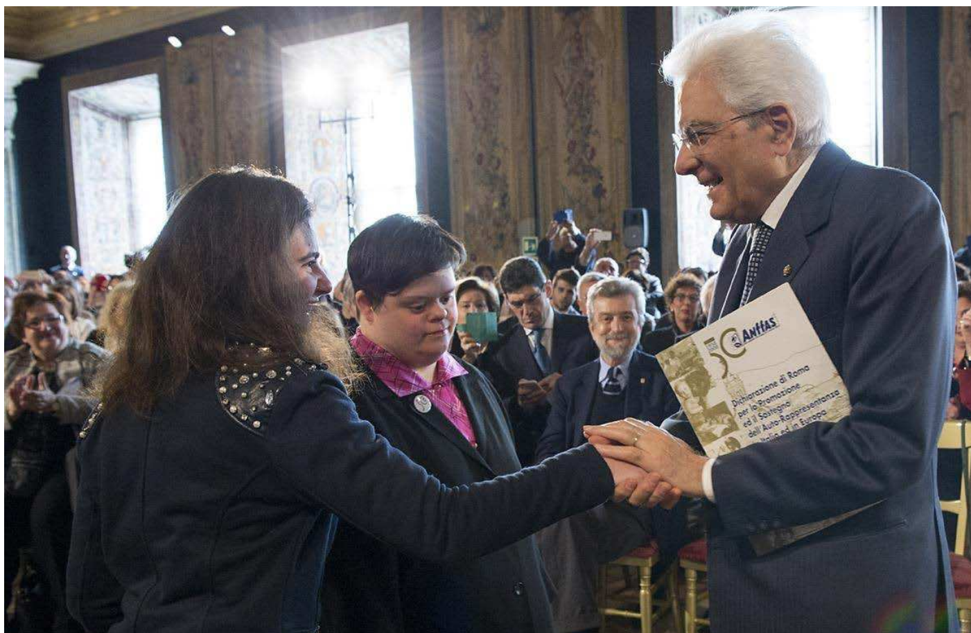
Francesca Stella e Serena Amato, autorappresentanti Anffas, consegnano al Presidente della Repubblica Sergio Mattarella la "Dichiarazione di Roma sul sostegno dell'autorappresentanza in Italia e in Europa" in occasione della Giornata Nazionale delle persone con disabilità intellettiva – Roma, 30 marzo 2016

di partecipare sono gli oggetti principali di attenzione. Ma una richiesta, tra tutte, apre lo sguardo verso il futuro. E' quella contenuta nella "Dichiarazione di Roma sull'autorappresentanza" che sancisce la volontà, espressa con una forza dirompente, dagli stessi autorappresentanti e che conclude con una affermazione che non lascia spazio a dubbi sulla strada da seguire: "questa sia l'ultima generazione di persone con disabilità intellettiva che vive discriminazioni, esclusione e negazione dei propri diritti" . Dichiarazione, quindi, che segna una nuova ed esaltante "pietra miliare" che interroga ed impegna tutti noi su come rendere concreto tale obiettivo.